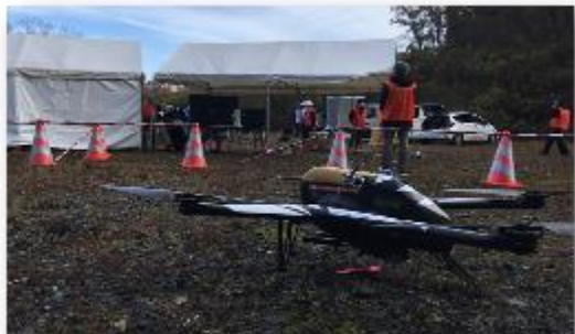
第2回意見交換会資料より抜粋